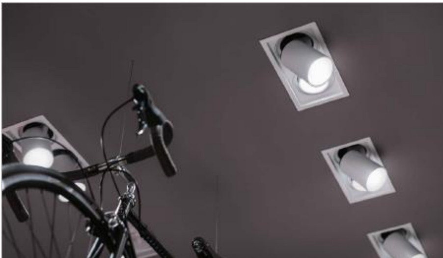
Afbeelding 1: Met de ingebouwde Tonic Gyro blijven de plafonds mooi strak